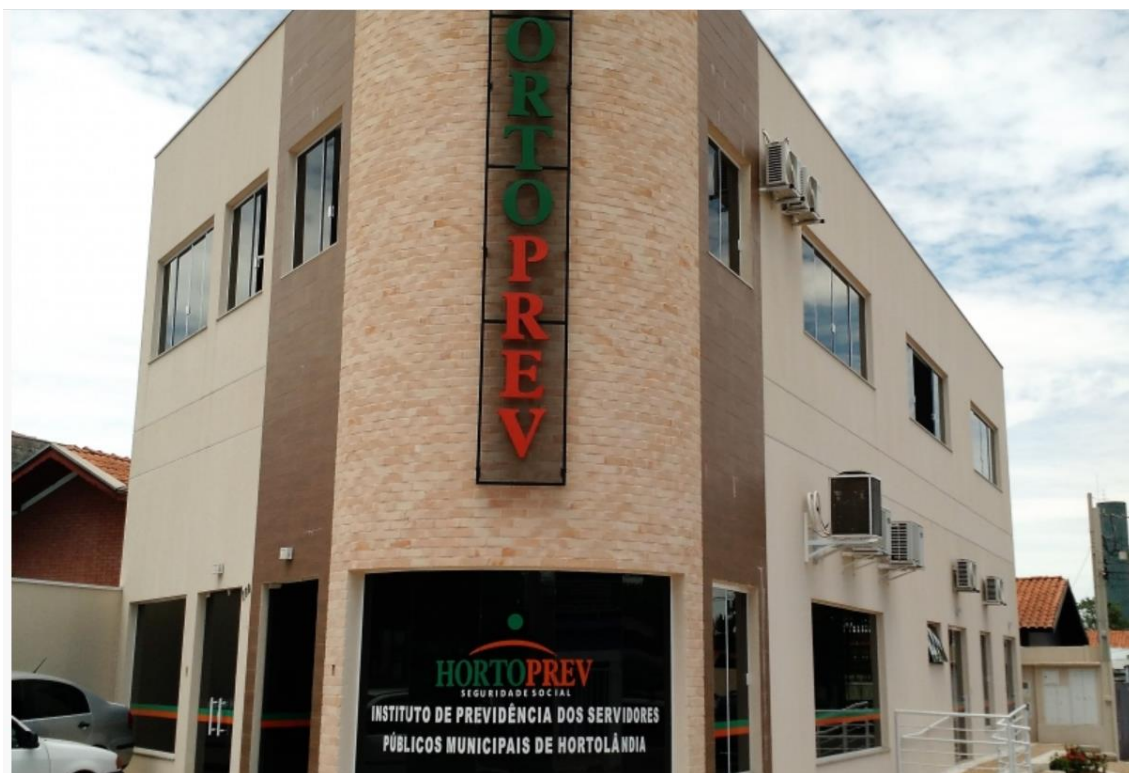
Figura 1 - Sede do Hortoprev

Há também um Conselho Fiscal, formado por 5 (cinco) conselheiros, que tem a função de fiscalizar os atos do Diretor e analisar as contas do HortoPrev, e uma Junta de Recursos, composta por 5 (cinco) conselheiros, que tem a função de julgar em última instância, recursos dos servidores municipais que se sentirem prejudicados nos seus direitos, por atos do Diretor Superintendente, sendo os pareceres e decisões lavradas em atas que serão encaminhadas ao Diretor Superintendente, que as acatará.