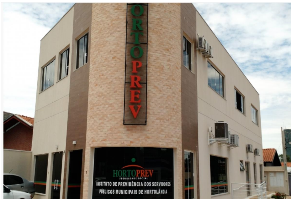
Figura 1 - Sede do Hortoprev

Endereço: Rua Alda Lourenço Francisco, 160, Remanso Campineiro, Hortolândia/SP Telefones (19) 3897-1115 / 3897-3739